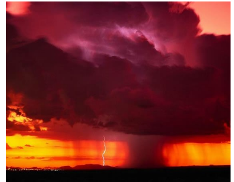
Célula de tormenta.

Las células de tormentas están apareciendo fuera de los principios conocidos como termodinámicos, se observan actividades de rayos en invierno donde la temperatura ambiental es muy baja para que exista una convección adecuada, entre la formación de la nube y la descarga del rayo solo hay un diferencial de temperatura de 2 grados , con mínimas de temperatura de 5 y máximas de 6 grados como ocurrió en invierno 2008 en Mallorca (5.11.2008) .