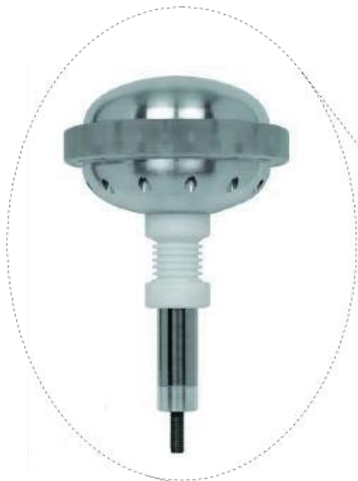
Desionizador de rayos PDCE